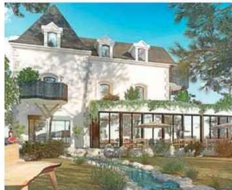
Une fois restauré, le domaine sera équipé d'un restaurant au rez-de-chaussée.