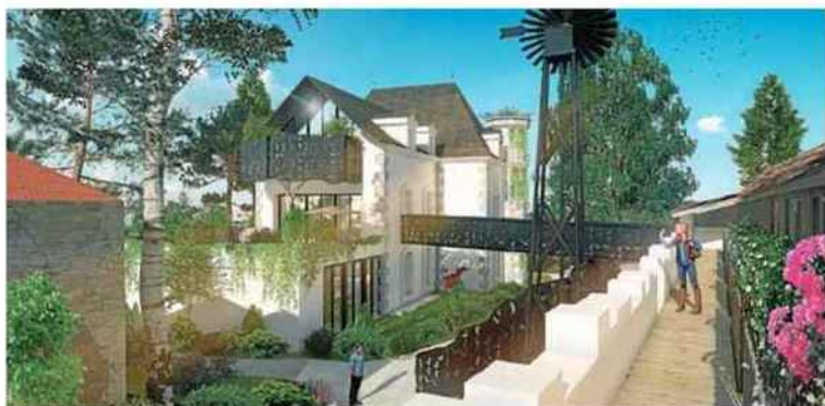
La bâtisse ne compte que deux étages et quinze chambres. "Nous voulons quelque chose de calme et d'authentique", pointe le chef d'entreprise.