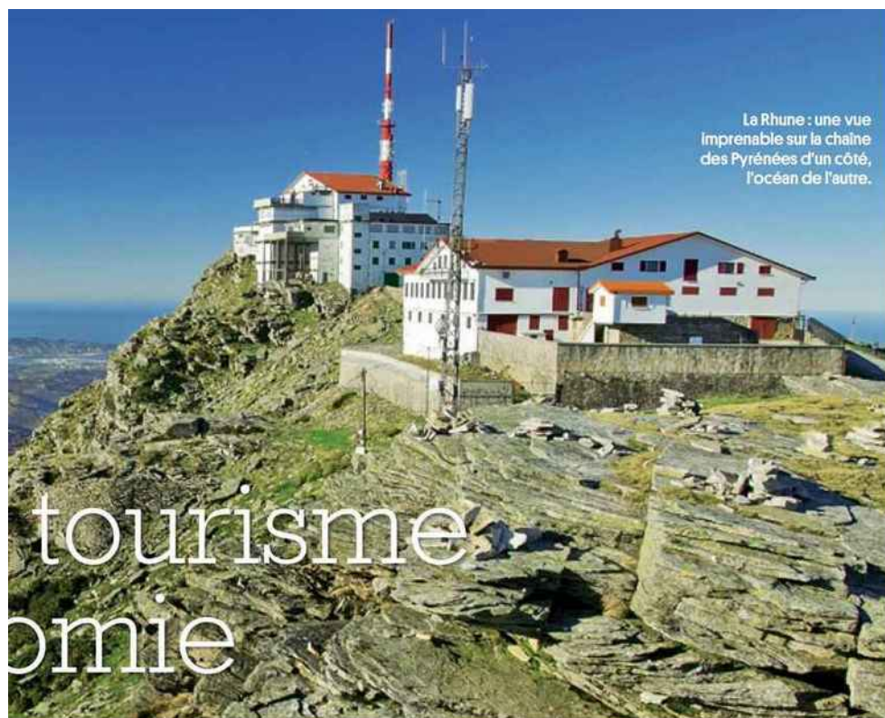
La Rhune : une vue imprégnable sur la chaîne des Pyrénées d'un côté, l'océan de l'autre.