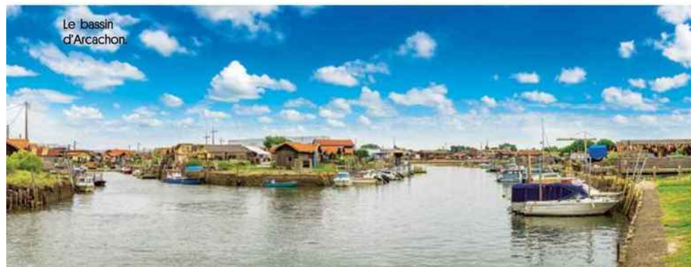
Le bassin d'Arcachon.

Léognan, des Graves, de Barsac et de Sauternes. Parmi les richesses patrimoniales, les châteaux forts de Villandraut, de Roquetaillade, de Cazeneuve et de La Brède, où naquit l'auteur des Lettres persanes , le baron de La Brède et de Montesquieu. Foie gras, cèpes, lamproie ou cannelés sont autant de spécialités à savourer en se délectant d'un verre des châteaux d'Yquem, Sigalas-Rabaud... Avec le bœuf de Bazas, on optera pour les rouges des châteaux des Carmes Haut-Brion ou Haut-Bailly. Depuis La Grande Maison, à Bordeaux, qui compte six chambres et le Restaurant Pierre Gagnaire, survolez le vignoble en hélicoptère ou partez sur le bassin d'Arcachon en pinasse (petite embarcation à fond plat) pour une dégusta-